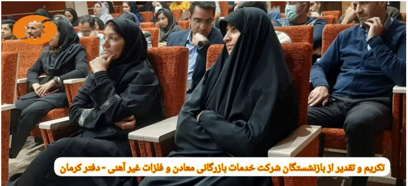
تکریم و تقدیر از بازنشستگان شرکت خدمات بازرگانی معادن و فلزات غیر آهنی - دفتر کرمان