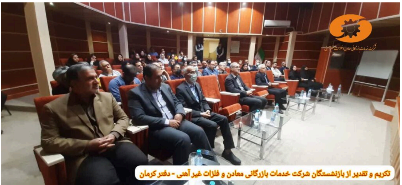
تکریم و تقدیر از بازنشستگان شرکت خدمات بازرگانی معادن و فلزات غیر آهنی - دفتر کرمان